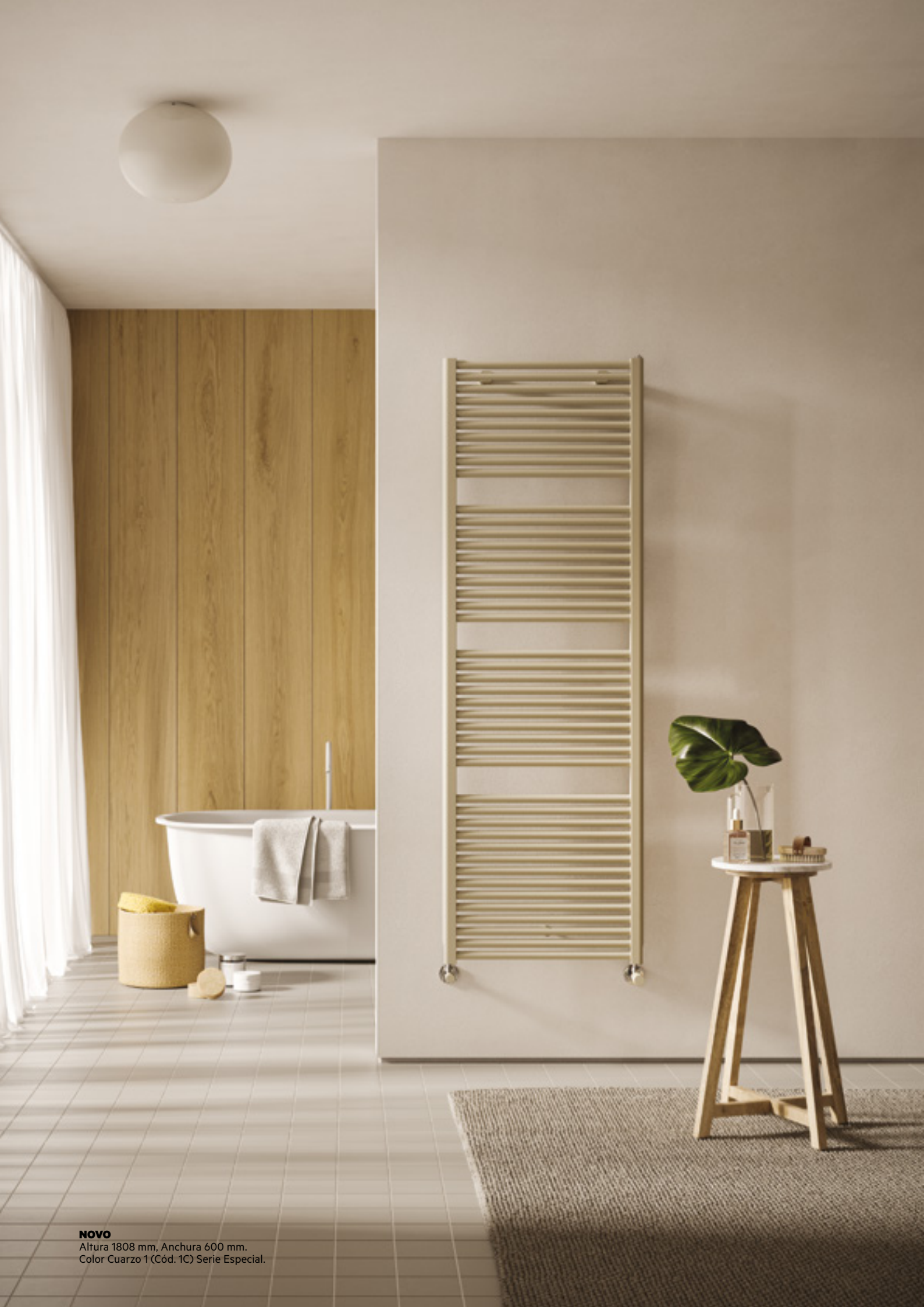
NOVO Altura 1808 mm, Anchura 600 mm. Color Cuarzo 1 (Cód. 1C) Serie Especial.