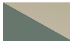
AGAVA PLAVA kod. 9N