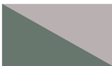
AGAVA PLAVA kod. 9N