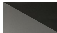
SREDNJE SIVA kod. 4D