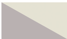
SVIJETLO SIVA MAT kod. 8N